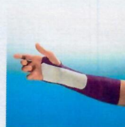
Variabilní opora Při použití dlahy 3M Scotchcast Longuette nebo 3M Scotchcast Plus a fixačního obvazu 3M Soft Cast je možno cíleně stabilizovat problematické oblasti.