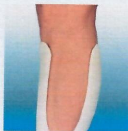
Obvaz dokonale přiléhá Není potřeba podkládat vatou.

má všestranné použití a poskytuje pacientům nebývalý komfort. Uživatelům - zdravotníkům nabízíme širokou podporu a školení: výuková centra v nemocnicích, výukové materiály, příručku a CD-Rom s názvem "Práce se Soft Castem" ("Working with 3M Soft Cast").